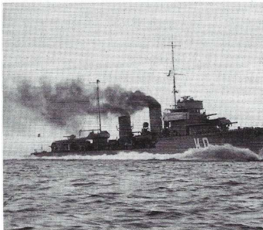
De Hr.Ms. Kortenaar II op volle kracht.

Wij schrijven november 1945 en bevinden ons in de Indische Oceaan. Wij stomen met een vierentwintig mijl 's vaartje van Aden naar Colombo. Wij hebben haast, want Nederlands-Indië heeft ons weer nodig. Op de bak een matroos, een oudgediende, die gedurende de oorlog in Nederland gevangen zat. Een gesprek: "Wat is het fijn, Commandant, om weer bij de Marine terug te zijn, het is net of je weer thuis bent. Ik heb vroeger ook op de jagers gediend, Commandant. Dit is een fijn scheepje, alleen nog erg vuil, maar we zullen er weer een jachtje van maken!" Wel, het schip is inderdaad een "jacht" geworden!